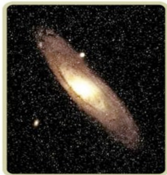
Andromedagalaxen, liknar i mycket vårt eget stjärnsystem, Vintergatan och ligger på 2,2 miljoner ljusårs avstånd.

Välkommen till den moderna naturfilosofin! Välkommen till det nya paradigmet!